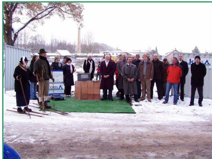
Poklepat na základní kámen nemohl Krakonoš, který se v té době staral vlekařům o sněhovou nadílku. Poslal tedy alespoň dva lyžníky, které vidíte nalevo.

Přejme si, aby stavba probíhala dle plánovaného harmonogramu a ke spokojenosti školy i sportující veřejnosti. Po otevření nové sportovní haly se Lánov konečně dočká možnosti plnohodnotného sportovního vyžití i v dlouhém zimním období.