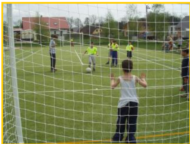
Neproměnná penalta v souboji o 5. a 6. místo.

Fotbalový turnaj pro žáky první, druhé a třetí třídy zorganizovala paní učitelka Krulišová v úterý 3. května. Turnaj doprovázelo na květen nebyvalé vedro a dusno. Na umělé trávě u budovy B zápolilo šest družstev ve dvou skupinách každý s každým na 2x5 minut. Dále se hrálo o umístění – vítězové skupin si to rozdali o první a druhé místo, druzí ze skupin o třetí a čtvrté místo, třetí se skupin o páté a šesté místo.