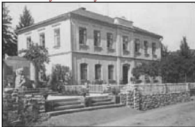
Pohlednice staré hornolánovské školy z dvacátých let minulého století.

1870 ✘ Vyšly nové zdravotnické zákony. Aby se zabránilo hromadnému vymírání obyvatelstva při epidemiích, měl mít každý okres školené zdravotníky. Do okrsku Klein-Elbe-Tal (Údolí Malého Labe) patřily: Dolní Lánov, Prostřední Lánov, Horní Lánov, Dolní Dvůr, Fořt, Čistá a Černý Důl. Ústředí sídlilo u nás v Prostředním Lánově. Plánovala se stavba železnice z Hostinného do Lánova. Dokonce vzniklo konsorcium obchodníků a továrníků. Realizace stavby kolejí do