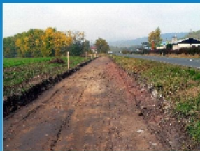
Cyklostezka Lánov - Vrchlabí etapa B