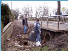
Dešťová kanalizace v lokalitě rod. domků za Ozdravovnou