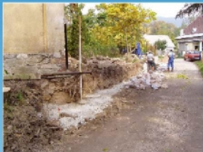
Rekonstrukce místní komunikace Horní Lánov