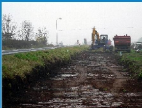
Cyklostezka Lánov - Vrchlabí etapa B