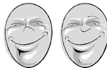
Najdi 5 rozdílů v kterých se obrázky liší!

Totéž přejeme všem lánovským občanům s výzvou: „Přijďte mezi nás, je mezi námi veselo!“