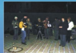
Zpívání u vánočního stromu