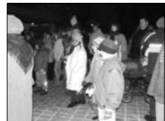
Zpívání u vánočního stromu

v Krkonosích jsou také Zimní autobusy, tzv. „zimobusy“, které jsou obdobou letních cyklobusů, jenž se velmi osvědčily. Jízdní řády naleznete jak v Krkonoské sezóně, tak na samostatných propagačních materiálech. Informace najdete také na autobusových zastávkách, kde budou vyvěšeny na plechových tabulích. Zimobusy mohou využívat nejen běžkaři, ale i další turisté či místní při běžné přípravě. Podrobné informace o zimobusech naleznete v samostatném článku pod rubrikou „Činnost Svazku měst a obcí“.