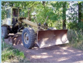
Rekonstrukce místní komunikace Horní Lánov