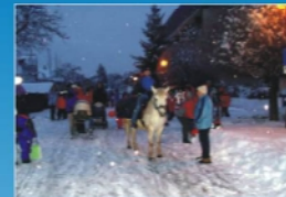
Martinský lampiónový průvod