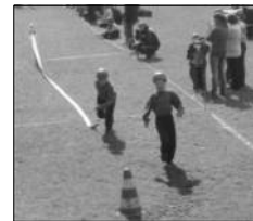
Hasičské závody Libňatov 15.9.2007

V měsíci říjnu jsme se vypravili na výlet na Černou horu. V pátek přišlo, a tak počasí odradilo spoustu účastníků. Ti, kteří věřili vedoucí, že bude slunečný den, nelitovali. Na vrcholku Černé hory nás uvítalo sluníčko, ale i dosti chladný vítr. Nám to nevadilo, byl krásný výhled do údolí, prošli jsme se po vrcholcích hor