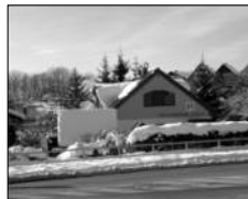
Infocentrum 16. listopadu 2007