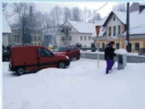
Rozšíření rozvodů kabelové televize