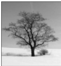
Zima v Lánově, foto Ivo Havlíček

Mimořádně výstla a krásně se o stromech okolo nás vyjádřil Václav Cílek v moudré a navýsost