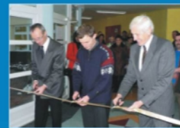
Slavnostní uvedení tepelné čerpadla při ŽS do provozu