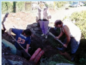
Rozšíření rozvodů kabelové televize