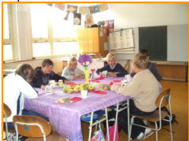
Slavnostní tečka.

Chybí organizace práce u první skupiny. Jirkovi padá pomazánka do klína.