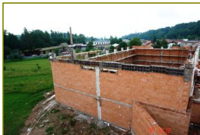
Pohled na budoucí chloubu Lánova – novou tělocvičnu. Hrubá stavba se blíží ke svému konci.