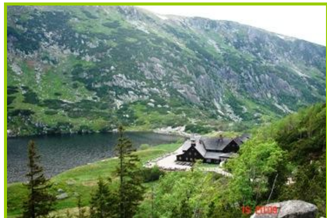
Samotnia v celé své kráse.