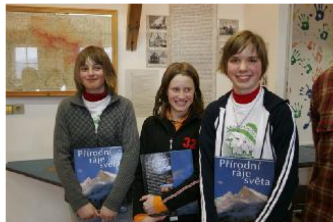
Šťastné vítězky při slavnostním vyhlášení vítězů, ekologické středisko SEVER, Horní Maršov.