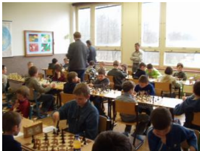
Momentka z turnaje.